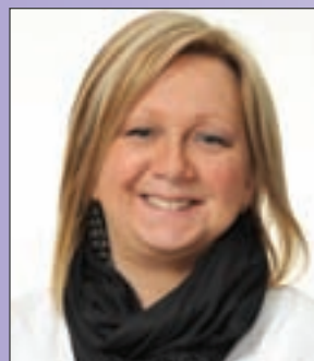
Par Lyne Mailhot Agente à l'habitation