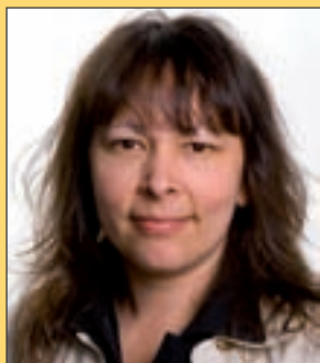
Par Nathalie Cardin Agente à l'éducation et au Registraire