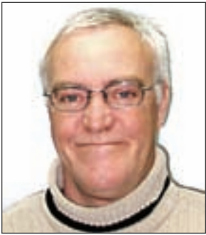
Par Paul Gosselin, agent de développement économique

Au début de cette chronique nous avons identifié les sept étapes à franchir pour en arriver au démarrage de notre entreprise, soit :